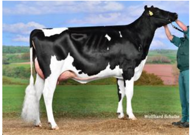
Suprem-Vollschwester WKM Lady