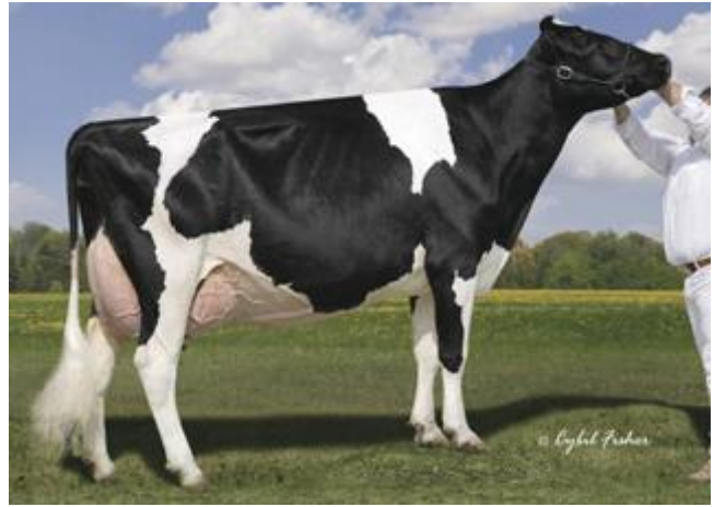
Stammkuh Lylehaven Lila Z