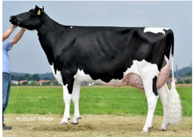
Royce-Großmutter Mabelle, 3. La.