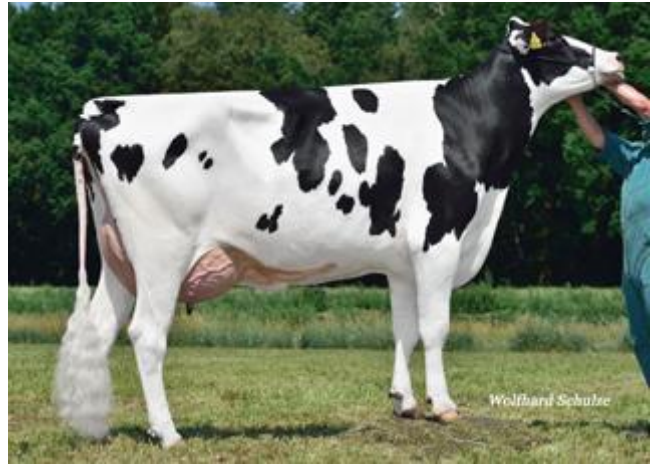
Jetson-Mutter GCG Rapunzel